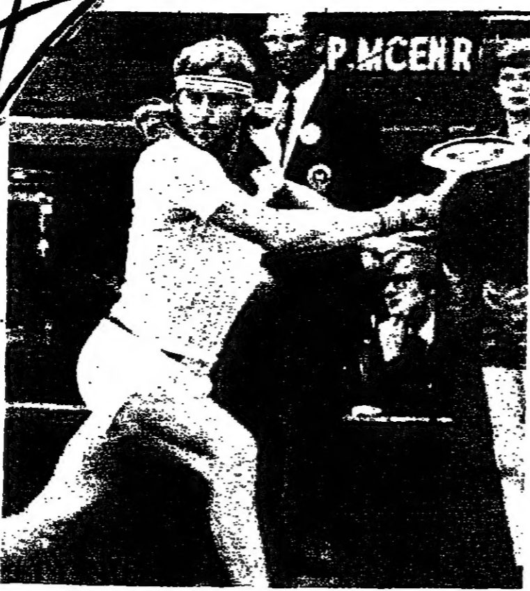
ويملكون - تغلب الرياضي السعودي بيرون بورغ على منافسه الأميركي جيون مكنو امس في مباريات ويمبلدون للصلول على بطولة العالم في لعبة التنس . وهذه هي المرة الخامسة على التوالي التي يحتفظ فيها هذا اللاعب السعودي ببطولة العالم في هذه اللعبة . وقال اللاعب السعودي انه بعد ان

وتكررت هذه الاتباء ان الاتفاق بشأن المقاتلات بين فرنسا وليبيا قد قطعت بعد ان مر مظاهرون ليبيون السفارة الفرنسية في طرابلس الغرب والقتالية الفرنسية في بنغازي في شهر شباط الماضي .